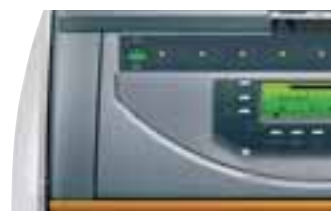
Régulation DIEMATIC 3 et CDI2 (en option)