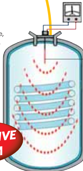
La nouvelle anode sans entretien