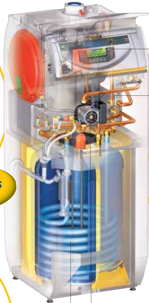
Pompe de chauffage et de charge ballon